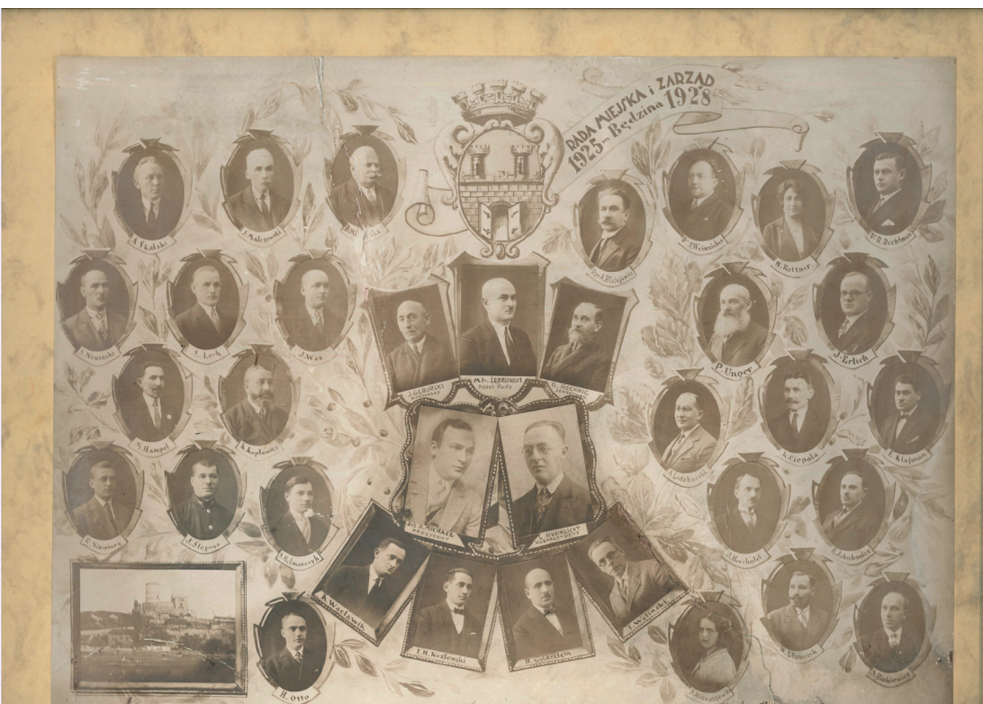
Fot. 14. Rada Miejska i Zarząd Miasta Będzina (1925–1928). Muzeum Zagłębia w Będzinie, numer inwentarza MB 322/H.