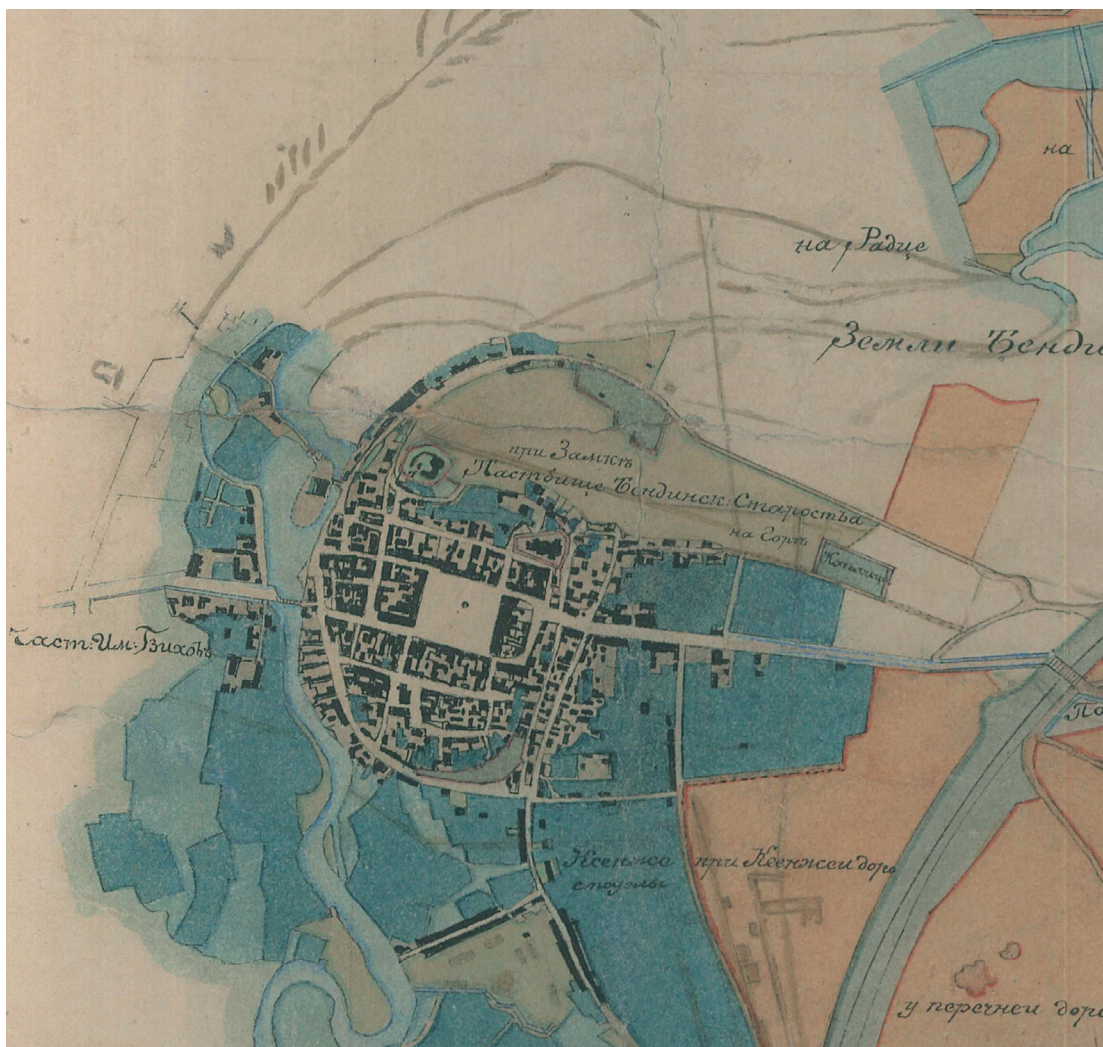
Fot. 13. Ogólny Plan Miasta Powiatowego Będzina w Guberni Piotrkowskiej z 1873 r. (fragment). Muzeum Zagłębia w Będzinie, numer inwentarza MB 188/H.