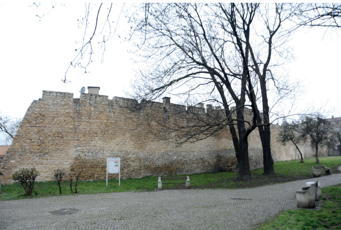
Fot. 12. Średniowieczne mury miejskie Będzina – współczesny stan zachowania.