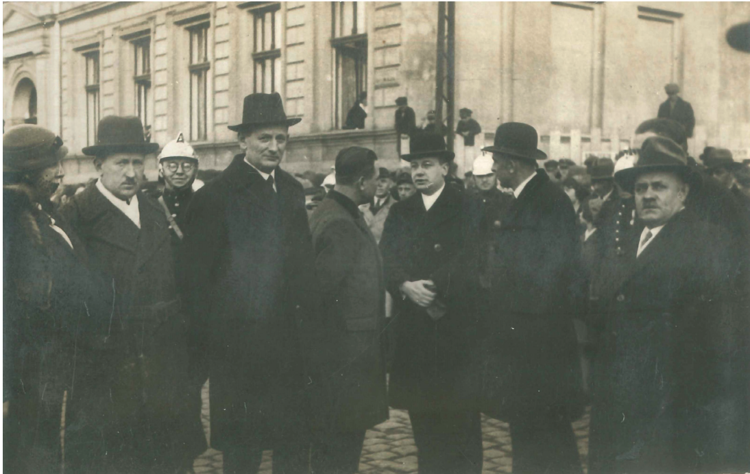
Fot. 15. Zdjęcie władz miasta Będzina z prezydentem Antonim Izydorczykiem (1935–1939). Muzeum Zagłębia w Będzinie, numer inwentarza 2025 F.